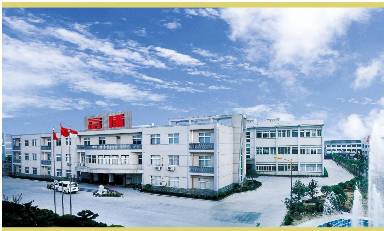
公司一角 / COMPANY CORNER